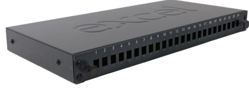
Panelin yüksüz ön kısmı