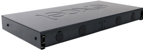
Panelin arka kısmı