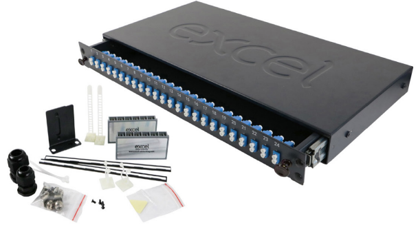
Aksesuar takımlı sürgülü panel